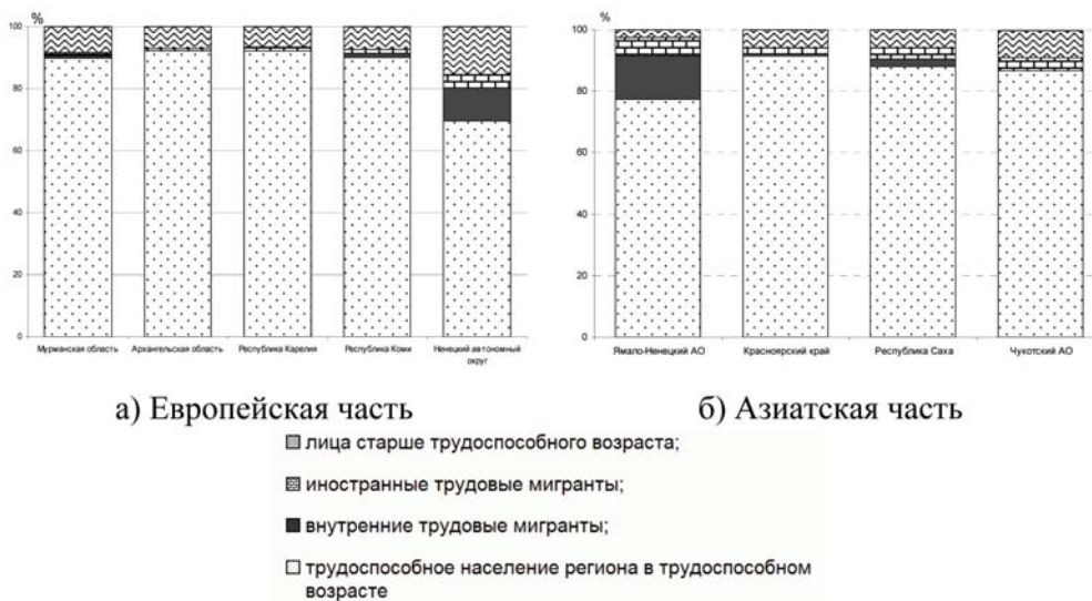
Рис. 2. Структура трудовых ресурсов по источникам формирования по регионам, 2013 г.

Российской Арктики доли внутренних и внешних трудовых мигрантов равны и составляют 3% в структуре трудовых ресурсов по источникам формирования. И хотя эта доля не столь велика, чтоб говорить о существенном вкладе внутренней трудовой миграции в численность трудовых ресурсов регионов, по сравнению с 2005 г. она выросла в 5,5 раз.